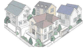
集団供給のお客様