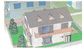
個別供給のお客様

※質量販売、国および地方公共団体、工業・農業用など高圧ガス保安法上の消費者は対象外となります。