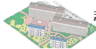
コミュニティガス団地のお客様