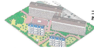
コミュニティガス団地の お客様