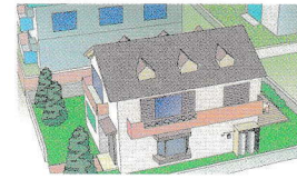
個別供給のお客様

※質量販売、国および地方公共団体、工業・農業用など高圧ガス保安法上の消費者は対象外となります。